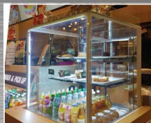
잠실 롯데몰 나무루POP