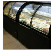
라운드 앞문 2단형