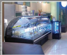
NC백화점 송파 테크노파크