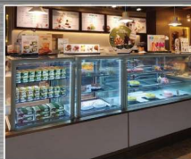
잠실 롯데타워 31층